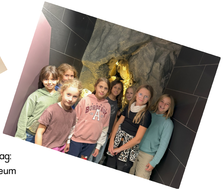
Ersatzprogramm am ersten Tag: Ausflug ins Nationalparkmuseum